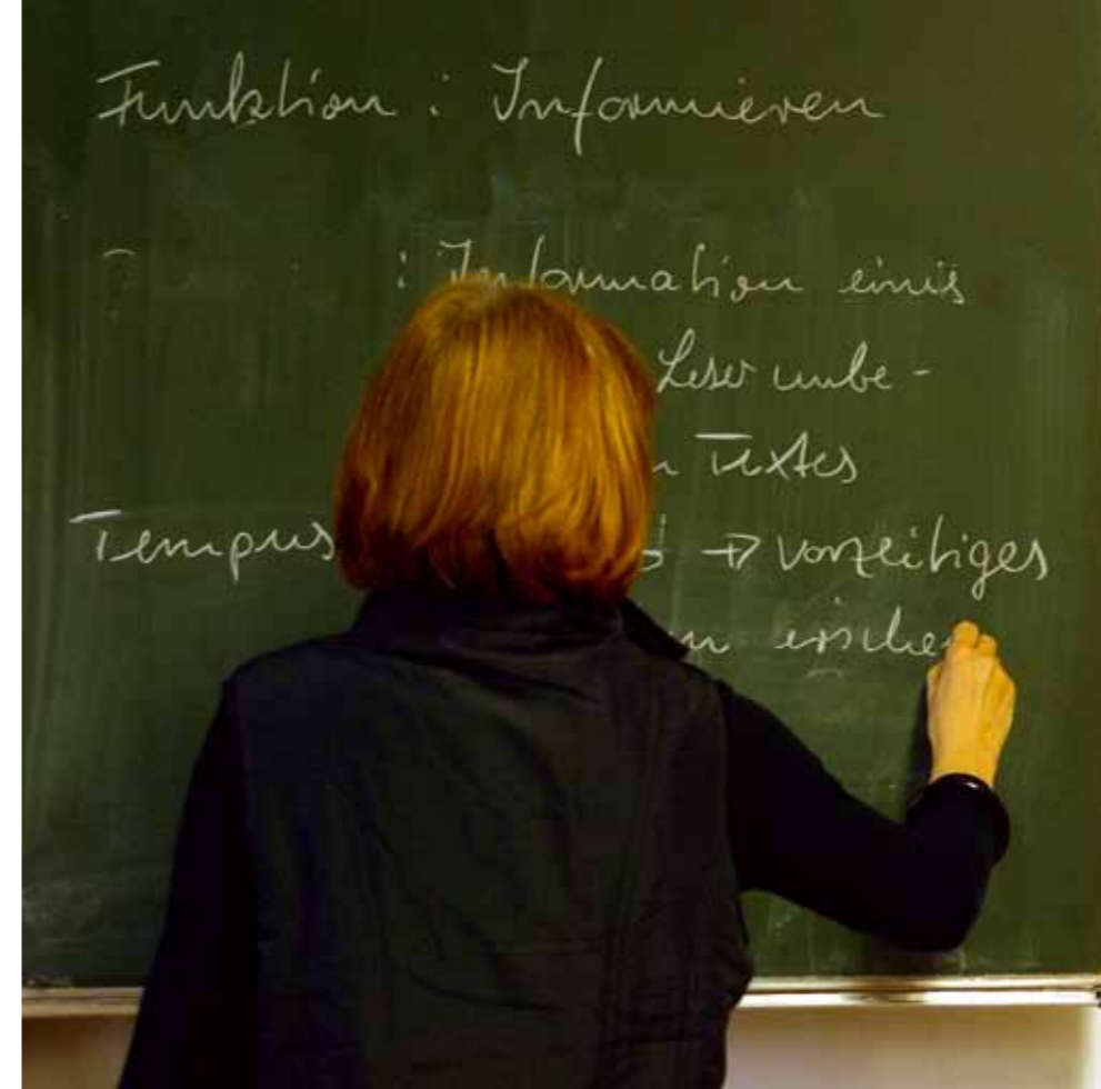
Aktiv setzen sich die Grünen gegen christliche Symbole wie das Kreuz im Klassenzimmer ein, fordern stattdessen islamische Feiertage in Deutschland.

„Arroganz“ nennt Schalk die Haltung, die der Entscheidung für Grün oft genug zugrunde liegt. „Einem wohlhabenden Menschen macht's nichts aus, wenn er mehr für sein Bio-Steak zahlen muss. Aber erzähl' das mal einem, der drei Kinder zu versorgen hat und 2000 Euro brutto verdient. Auf die Leute zu schimpfen, die im Discounter einkaufen, ist anmaßend.“ Dass der Biospritwahn die Getreidepreise in manchen Gegenden dieser Welt im vergangenen Jahr um 40 Prozent hat steigen lassen, passt ins Bild: Womöglich waschen da ein paar Wohlhabende ihr schlechtes Gewissen auf Kosten der Armen rein.