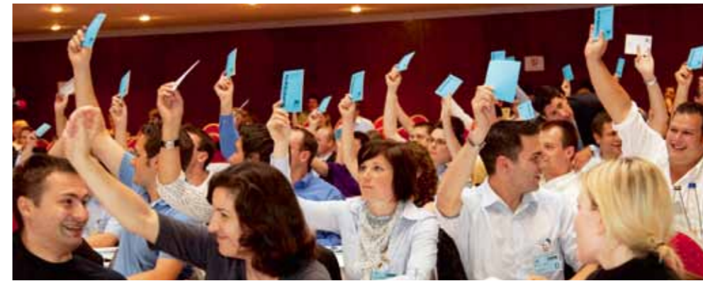
Mitwirken leichtgemacht: In der Jungen Union kann sich jeder einbringen.