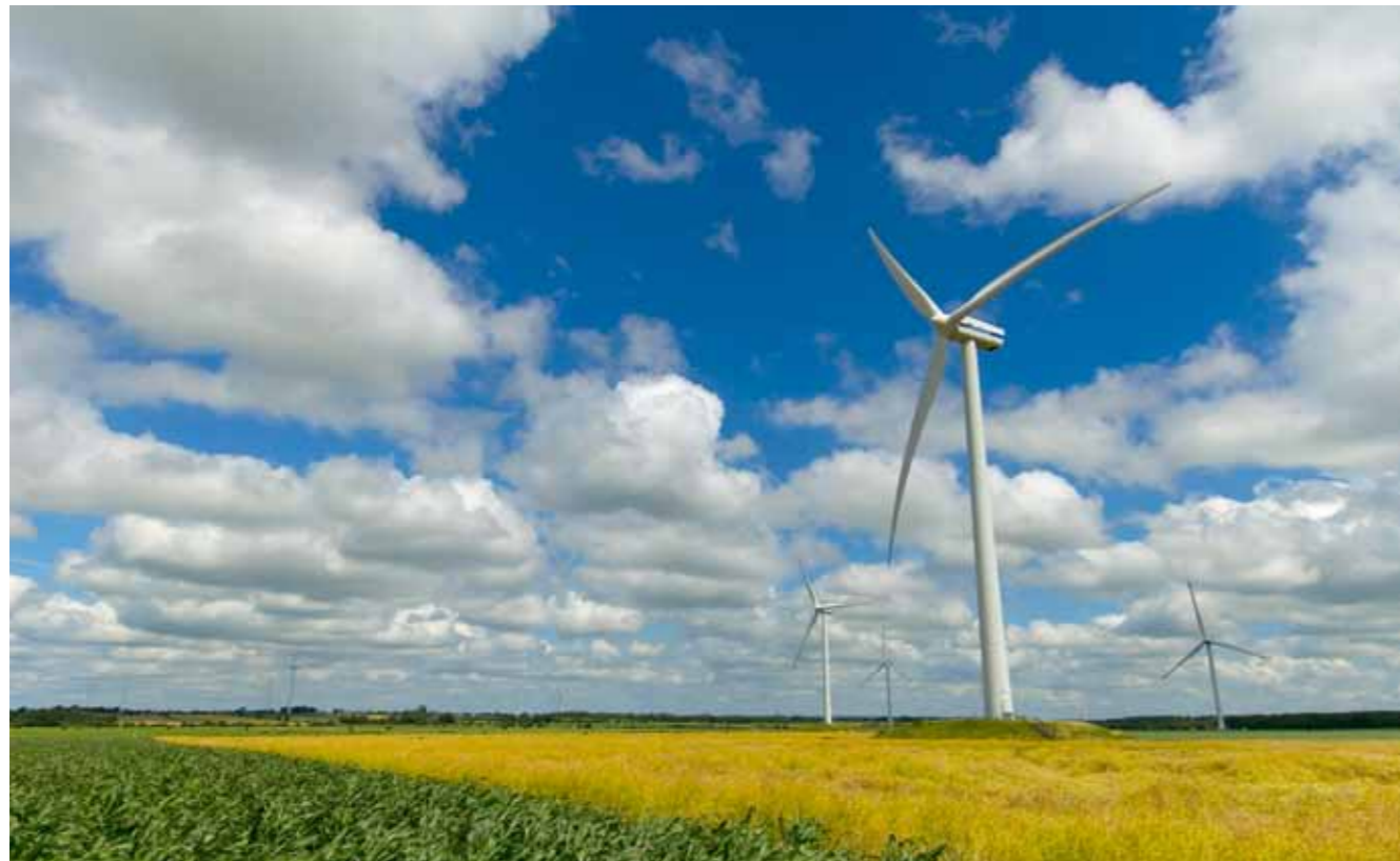
Zwei Gesichter: Man ist als Grünen-Wähler für Windenergie, schließt sich aber flugs der nächsten Bürgerinitiative an, soll ein Windrad in Vorgartensichtweite errichtet werden.